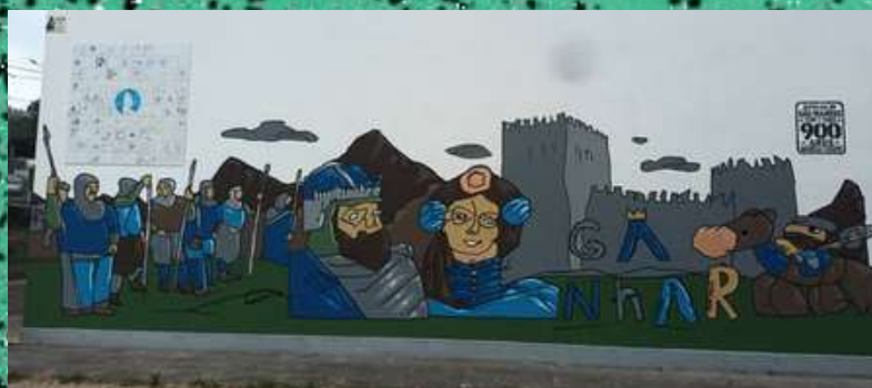
ESCOLA BÁSICA DE SILVARES