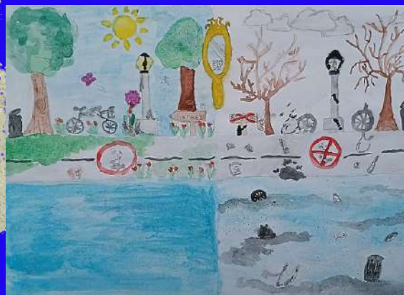
Luna, 6.º E