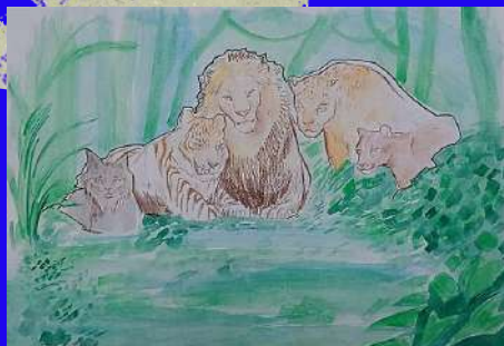
Sophia, 7.º B