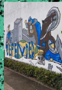
ESCOLA BÁSICA DO SALGUEIRAL

No âmbito das comemorações dos 900 anos da Batalha de S. Mamede, os alunos das Escolas Básicas do Salgueiral e de Silvares criaram murais alusivos à efeméride, dando vida a paredes de ambas as escolas. Esta atividade foi desenvolvida na CAF (Componente de Apoio à Família), em articulação com a Câmara Municipal de Guimarães.