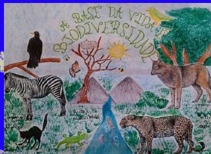
Leonor, 7.º B